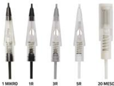
Fot. 3 Igły modułowe-cartridge

Kosmiczne prędkości urządzeń, do których tak bardzo przekonują producenci, przeznaczone są jedynie do wybranych technik. O ile rewelacyjnie sprawdzają się wśród praktyków z dużym doświadczeniem zawodowym do wykonywania makijażu wymagających „wyższej szkoły jazdy”, jak na przykład brwi metodą włoskową, gdzie podczas bardzo powolnej stabilnej pracy ręki wysycamy maksymalnie liniowo włos w jak najkrótszym czasie (wykorzystujemy urządzenie do makijażu permanentnego, jak przysłowio- wą maszynę do szycia, która z dużą mocą nakuwa miejsce przy miejscu skórę), o tyle podczas klasycznego cieniowania brwi, ust czy pigmentacji delikatnych powiek – zwłaszcza w przypadku osób początkujących duże prędkości urządzenia nie mają znaczenia. Ba, nawet nie powinny być wykorzystywane, ze względu na brak dostatecznej stabilności ręki u osób rozpoczynających karierę w tym zawodzie i delikatności powierzchni, na której się pracuje (czytaj wrażliwej skórze wokół oczu). Techniki dające delikatne nasycanie danej powierzchni kolorem, jak popularne dziś ombre, polegają najczęściej na szybkiej pracy ręki i kontrolowanym rozcieraniu koloru. Nie ma więc potrzeby, by używać wysokich prędkości, skoro ruch ręki jest szybki na tyle, że skóra nie ma szansy odczuć pracy urządzenia.